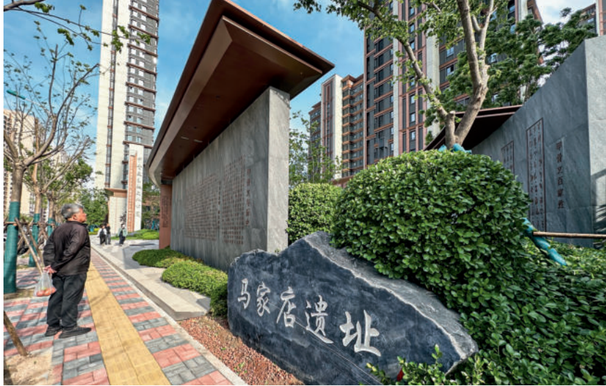
甲骨文主题文化公园,融合场地历史记忆,创造多样性的城市空间,为马家店遗址注入新活力

是城市的灵魂。坚持保护为先,完成13个地块的考古调查,有序推进完成天津西站主楼、瑞蚨祥绸布店等文物建筑修缮和义和团纪念馆后殿修缮、消防改造,积极推动天津普通中学堂旧址修缮项目纳入市级项目库并争取市保资金,最大限度保存革命文物和红色资源原貌。注重活化利用,在中国学者首次鉴定甲骨文之地——马家店遗址建成开放甲骨文主题文化公园,让厚重历史从书本典籍走进生活日常。扎实推进非遗系统性保护,公布区级第十、十一批非物质文化遗产代表性项目名录,全区非遗代表性项目达90项,传承人总数增至104人,“西码头百忍京秧歌高跷”等2个项目入选第五批国家级非物质文化遗产代表性项目名录,我区国家级非遗代表性项目增至4项。