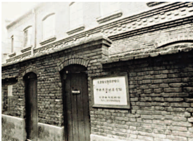
中共天津地委旧址

体共产党员在法租界24号路(现和平区长春道)普爱里34号举行中共天津地方执行委员会成立大会。于方舟当选为中共天津地方执行委员会委员长,江浩为组织部主任,李锡九为宣传部主任,同时决定将中共天津地委机关设在普爱里34号。