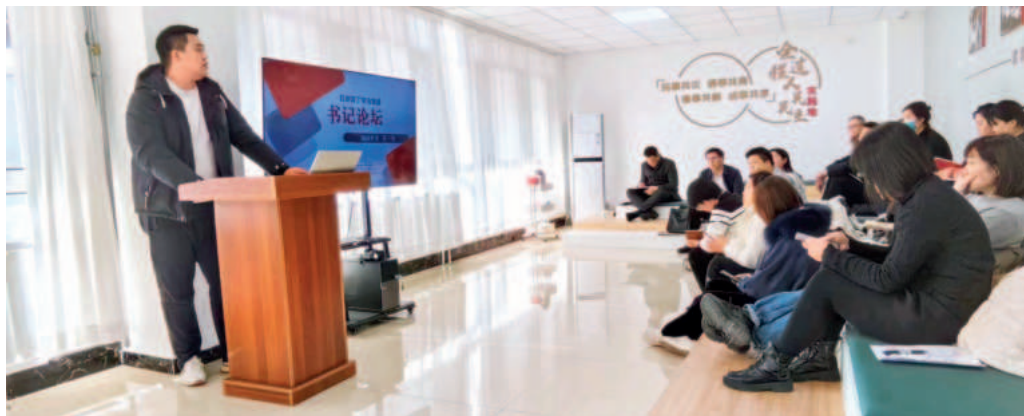
丁字沽街道书记论坛现场

双网融合、联动共治,总结推广“治安防范共巡、矛盾纠纷共调、特殊人群共管、服务提升共抓”工作举措,初步形成网格融合、平台融合、资源融合、工作融合的“四融四共”工作模式。坚持问题导向,紧盯薄弱环节,“警网”联动发力,推动社区警务与网格管理、志愿力量辅助有机融合,及时排查处置风险隐患,有效推动矛盾化解由“被动应对”向“主动介入”转变,实现“微事不出网格,小事不出社区,大事不出街道”。三是强德治,扩大“辐射力”。打造“老街旧邻”服务品牌,融通“睦邻达人”招募、“睦邻伙伴”引领、“睦邻空间”焕新、“睦邻行动”营造四大行动,激发社区单位、社会组织、群众团队等多元主体参与基层治理,营造有温度的邻里社群,在共享、互动中产生情感凝聚,推动空间邻里关系升级,进一步发挥睦邻达人队伍“领、育、议、联、行”功能,实现党建引领、队伍培育、议事协商等,提升老旧小区基