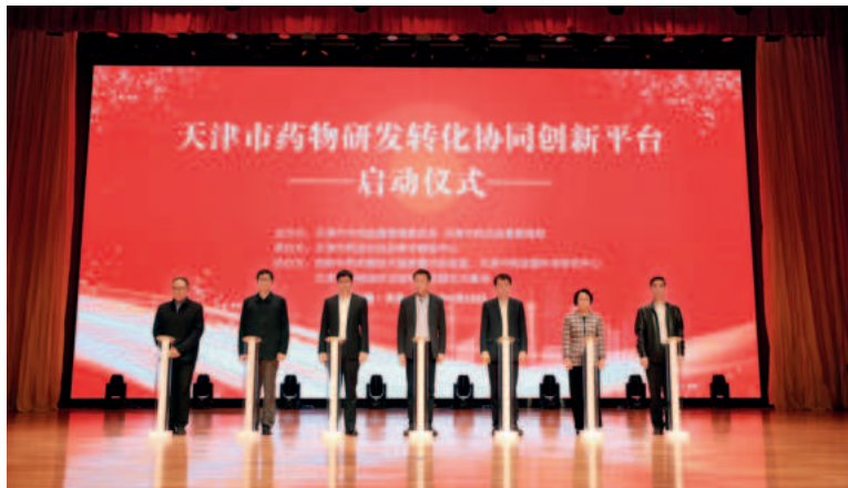
2023年4月26日,天津市药物研发转化协同创新平台启动成立