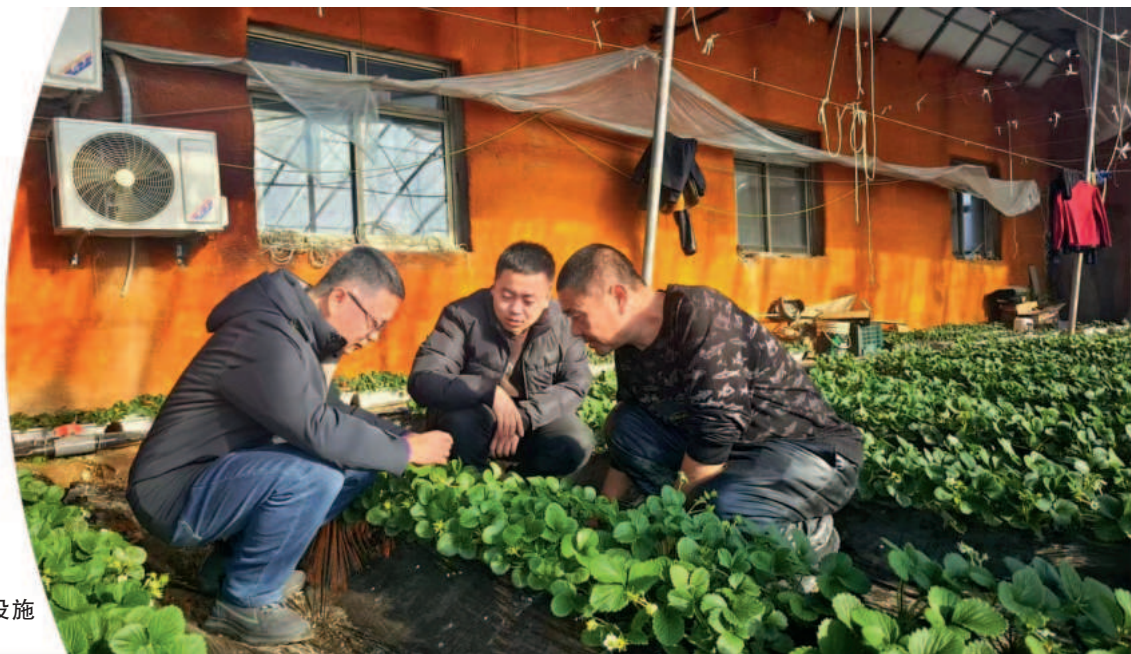
乡镇干部深入设施农业项目推动指导