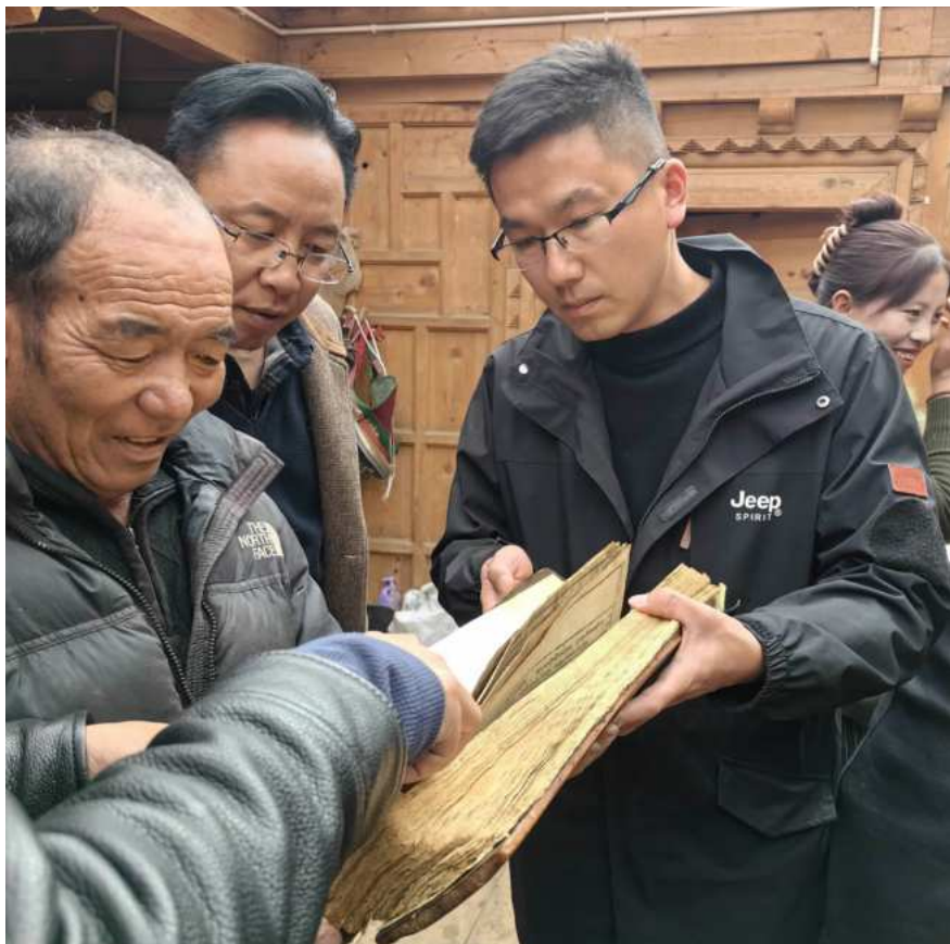
援派干部(右)向当地村民发放《藏医药典籍》