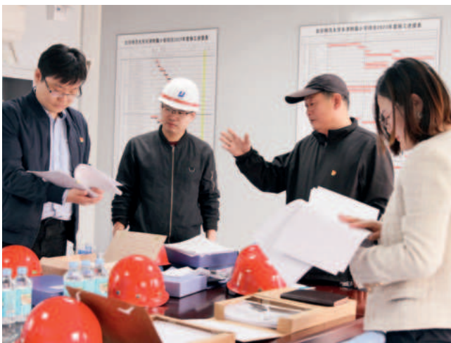
河西区纪检监察干部深入学校项目建设工地向项目负责人了解工程建设进展情况

巩固拓展学习贯彻习近平新时代中国特色社会主义思想主题教育成果，以更高标准、更严纪律锤炼过硬的政治素养、履职本领和纪律作风，始终做到绝对忠诚、绝对可靠、绝对纯洁。区纪委监委带头加强自身建设，严肃落实“第一议题”制度，深学细悟习近平新时代中国特色社会主义思想，引领带动全区纪检监察干部坚定不移做“两个确立”忠诚拥护者、“两个维护”示范引领者。树立重实干实绩的鲜明用人导向，加强关键岗位领导干部素质能力作风建设。加强对纪检监察权力运行监管，坚持刀刃向内，常态化清除害群之马，坚决防治“灯下黑”，努力作自我革命的表率、遵规守纪的标杆。做实做细关心关爱干部工作，激活纪检监察干部干事创业的内生动力、提升担当作为的精气神。■