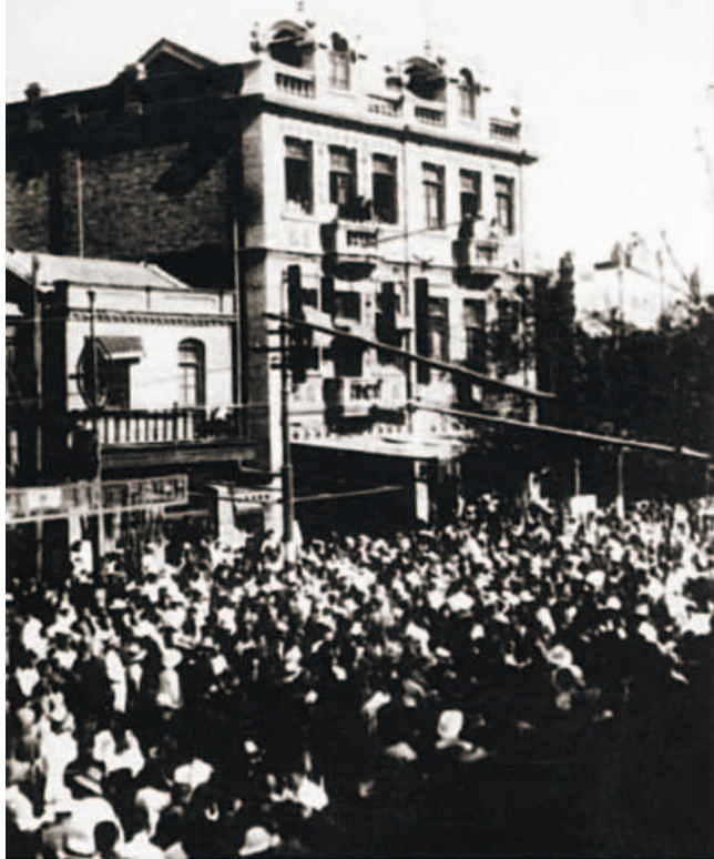
五卅运动中天津人民游行示威的场面