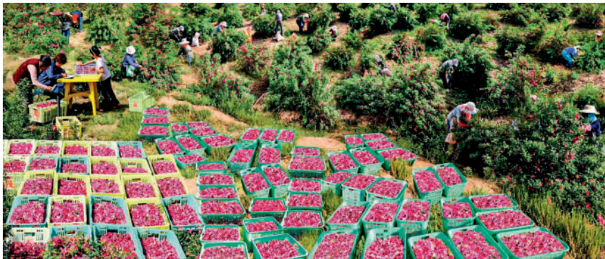
甘肃省兰州市高崖镇沙河村村民采摘高原夏菜