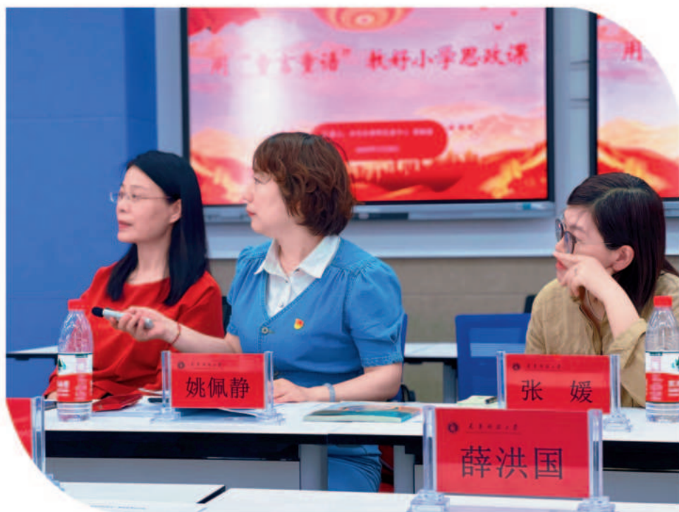
▲在天津市大中小学思政课一体化教学研究联盟组织的集体备课会上,教研员和思政课教师们展开热烈研讨