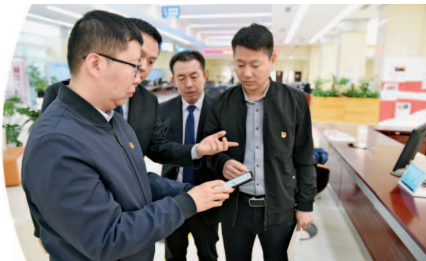
宝坻区纪检监察干部了解“陪跑”服务办理流程

宝坻区纪委监委将履行监督第一职责与服务发展第一要务紧密结合，树立“监督+服务”理念，把优化营商环境、构建亲清政商关系作为强化监督执纪的重点内容，在区内186家重点企业（项目）设置优化营商环境服务监测点，把监督触角延伸到对营商环境感受最灵敏、反映最直接的“用户端”，靠前监督、精准施治，通过这一纪企“直通车”机制，建立起遍布全区的“传感器”，精准发现营商环境方面