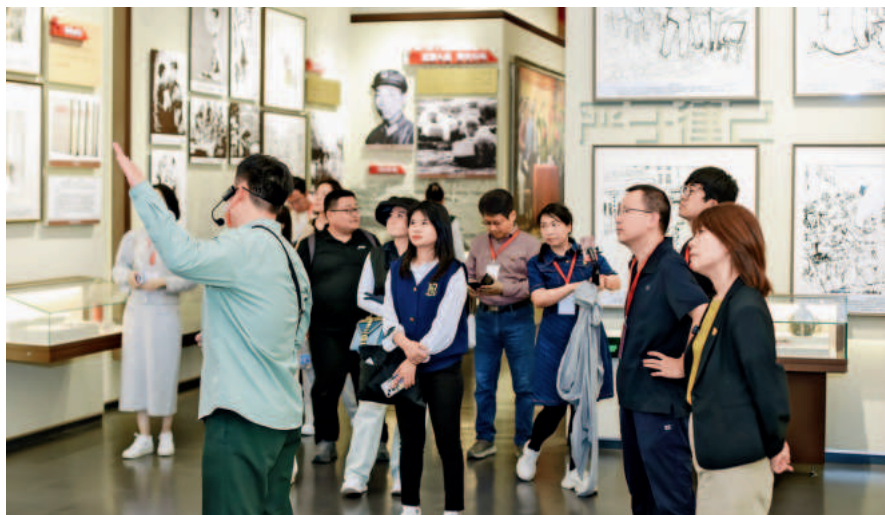
天津市网络思政名师工作室(济宁站)工作坊培训会学员参观鲁西南战役纪念馆

让思政课发展环境和整体生态更优，使思政课教师潜心育人的底气更足，让广大青少年学生精神面貌更奋发昂扬，作为全国“大思政课”建设综合改革试验区的天津，正不断交出思政课教师队伍建设的优异答卷。✎