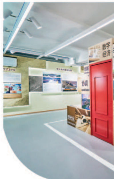
▲天津外国语大学中外制度比较思政课重点实验室中外经济发展比较厅