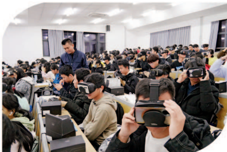
▲ 200 名学生佩戴 VR 眼镜“走进”红色场馆，感悟伟大建党精神