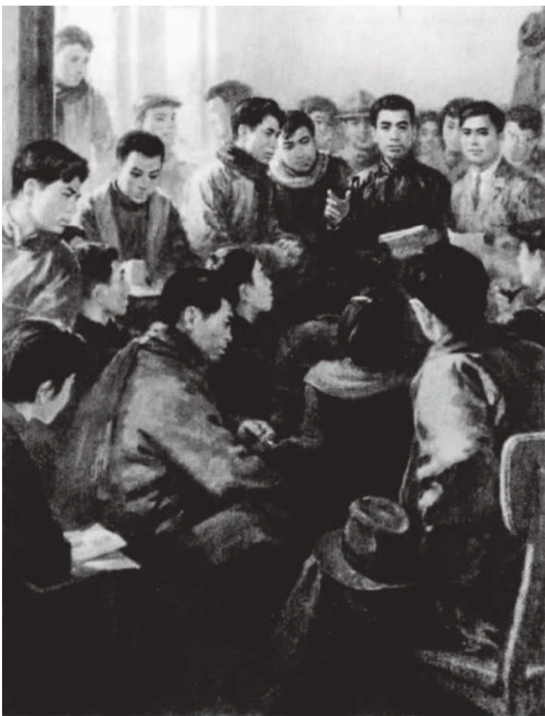
中共顺直省委扩大会议油画