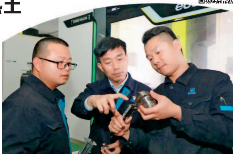
河东区人才创新工作室领衔人带领团队进行核工业专用设备制造科研攻关

“翔东计划”升级版重点完善了招才引智和招商引资并轨推进机制,将人才引进、落户安居、子女入学等支持政策全面纳入政企战略合作协议和合作备忘录,成为河东区招商引资的重磅砝码。“翔东计划”升