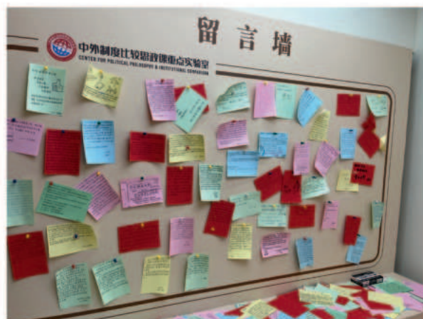
▲ 我市大中小学校学生在参观中外制度比较思政课重点实验室后的留言