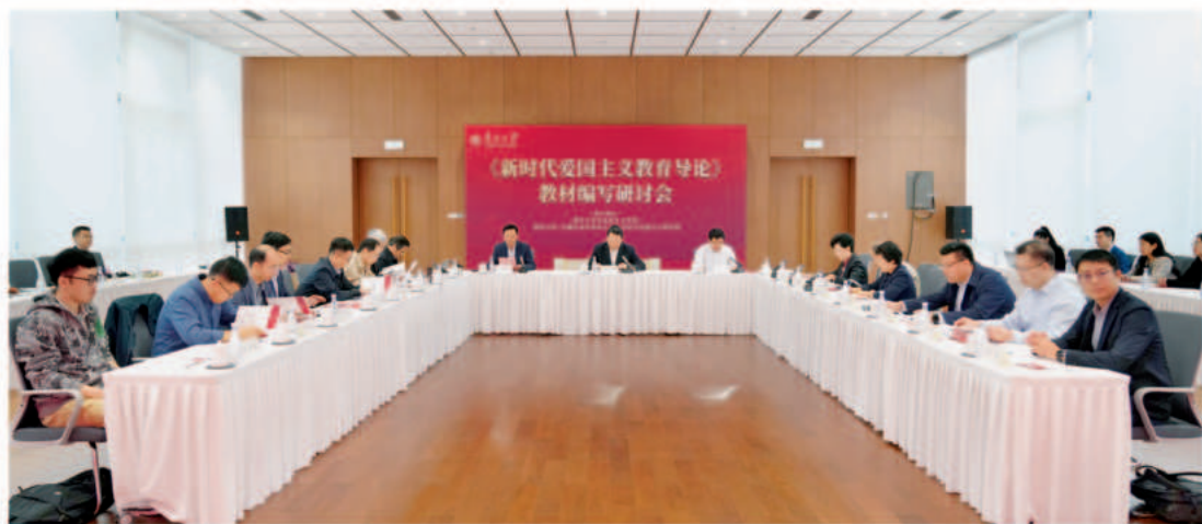
▲《新时代爱国主义教育导论》教材编写研讨会在南开大学举行