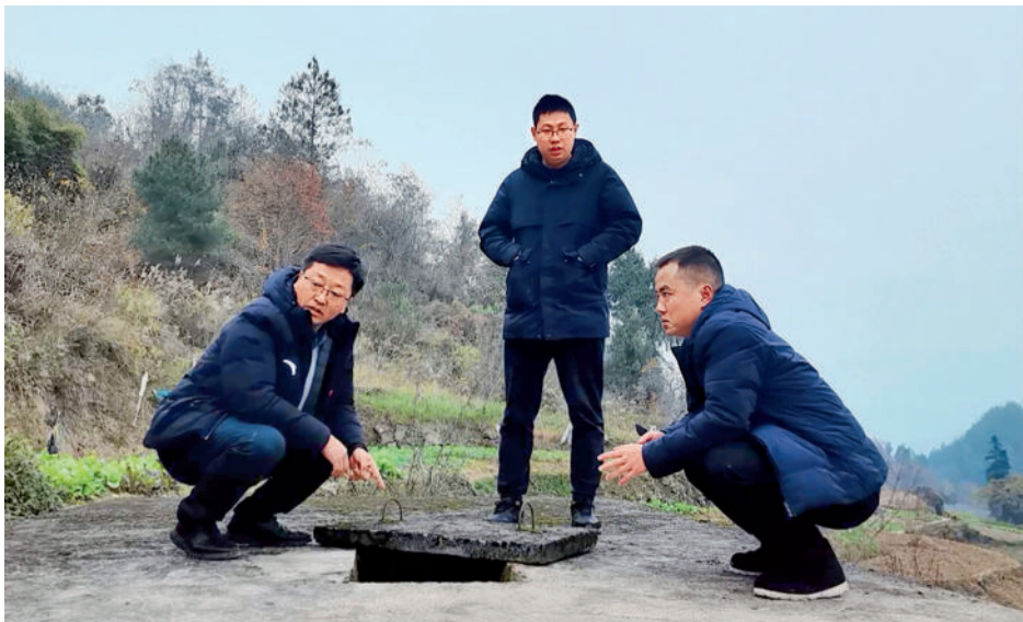
作者(左一)与同事调研万州区农村饮水安全问题