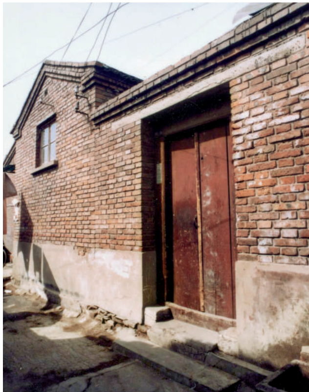
图为青年抗日先锋队党支部旧址(原和平区清和街芦庄子胡同6号,已拆除)

了!”12月9日,在中共北平临时工作委员会的领导下,北平爱国学生6000余人,高呼“停止内战,一致对外”“打倒日本帝国主义”等口号,举行了声势浩大的抗日救国示威游行。为声援北平,12月18日,天津10余所大中学校