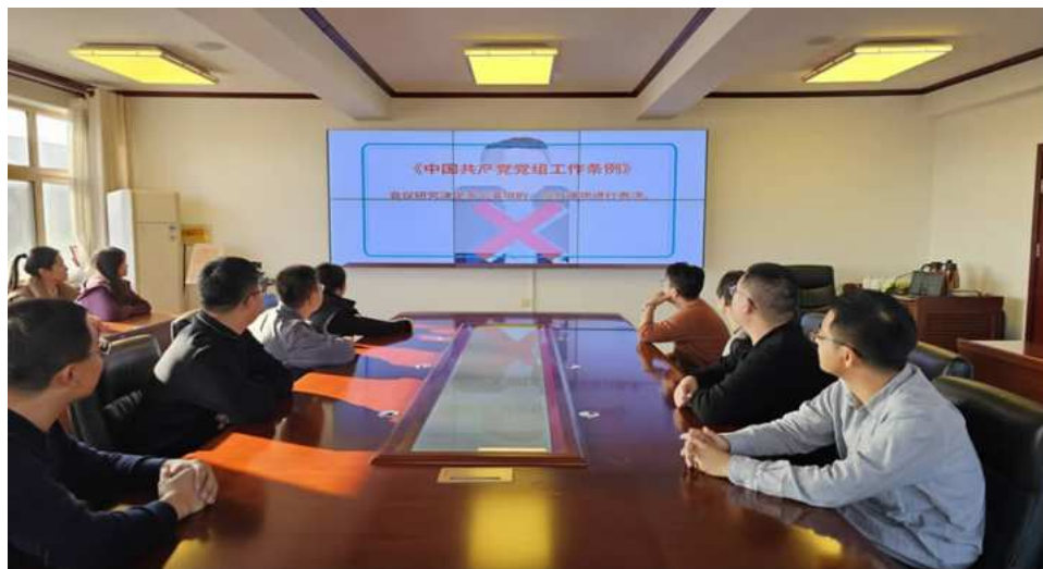
衢州市委组织部设计制作动画视频加强党员学习