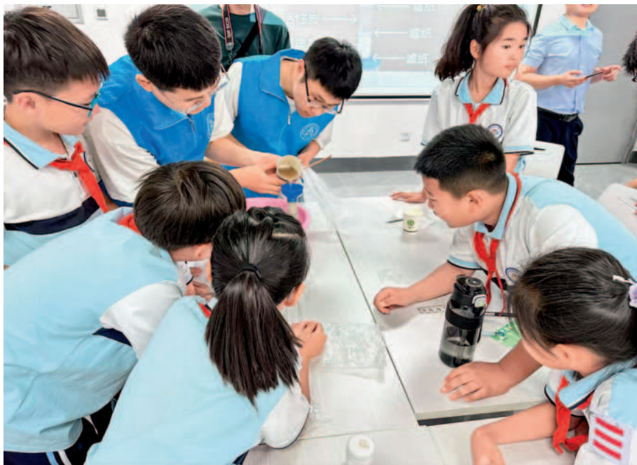
在世界环境日,党支部带领小学生一起做科普实验

每周学习计划,严把学习内容,积极邀请业务团队非党员师生参与,通过持续深化政治理论学习,提升师生理论指导实践能力,为推动和解决阶段性重点工作、难点问题提供思想理论支撑。为响应国家对科技创新及生态文明建设的号召,结合学院教学实际,党支部开展“加强党建引领,促进科技创新”系列主题党日活动,以国际专家线上报告、领域专家线下交流、实验室参观体验等形式组织了6场科技交流与学术活动,为新专业建设提供了课程实践经验,为培育环境能源研究领域青年人才提供了交流平台。