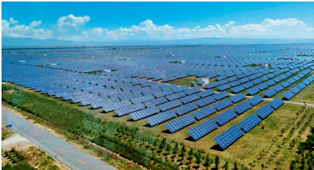
共和县塔拉滩上的光伏发电基地

江河一脉,同心筑梦。坐落在西宁市的青海果洛西宁民族中学就是铸牢中华民族共同体意识的最好见证。位于青藏高原腹地的青海省果洛藏族自治州,海拔达到 4200 米。如何让牧区的适龄孩子接受到应有的教育,是当地党委、政府最牵肠挂肚的一项重点工作。近年来,在上