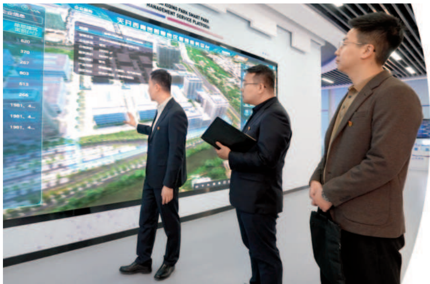
西青区纪委监委第三纪检监察室联合精武镇纪检监察组深入天开高教科技园西青园服务大厅开展体验式监督

任重道远须策马，风正潮平好扬帆。西青区纪委监委将坚决扛牢政治责任，推动健全全面从严治党体系，深入推进党风廉政建设和反腐败斗争，一如既往坚守初心，用心用情服务人民群众，始终保持忠诚干净担当的政治本色，以更高的站位、更强的担当、更硬的措施、更实的作风，为区域经济社会高质量发展保驾护航。✎