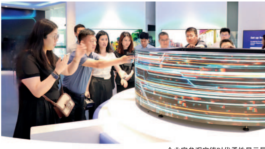
企业家参观宁德时代柔性显示屏

近年来,西青区持续实施人才强区战略,政治上爱护、思想上关怀、工作上支持企业家队伍建设,出台“人才强区十五条”,推出“青英人才服务卡”,举办“向专家人才汇报”政策宣介交流会,设立“5·15”西青人才日,多措并举优化企业家发展环境,“头雁强翼”企业高级管理人员国情研修活动已成为西青区支持企业家队伍建设的品牌亮点,是区委、区政府服务经济社会高质量发展的生动实践。新质生产力是推动高质量发展的内在要求和重要着力点,企业家在打造企业核心竞争力、促进产业创新发展和产业体系构建、释放新质生产力效能中发挥着至关重要的作用。未来,西青区将持续支持鼓励企业家主动承担新时代赋予的历史使命,践行企业家精神,加强自主创新,勇于开拓进取,不断培育和发展新质生产力,实现质量更好、效益更高、竞争力更强、影响力更大的突破。✎