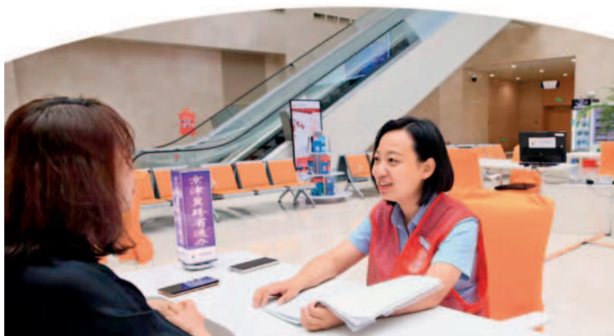
滨海新区政务服务办自助帮办区工作人员解答群众咨询

“真是太好了，本以为要跑几次才能办完呢，没想到一次申请就实现了营业执照和道路运输经营许可证全程线上联办！”6月26