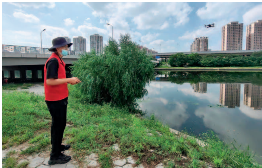
工作人员利用无人机对重点点位进行巡查