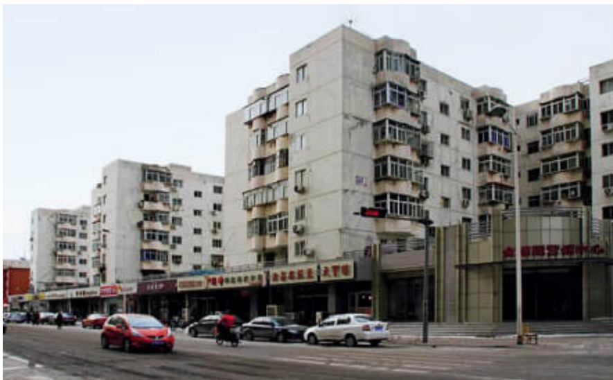
信昌里10号所在地现状

刻字社里的雕刻声传递着战略部署，租界别墅中的无线电波跃动着情报密码，临时家庭的随机应变掩护着机关周全，书香氤氲的读书沙龙酝酿着觉醒的惊雷，码头货轮的夹层暗舱里深藏着送往根据地的希望……在抗日的硝烟烽火与敌后的隐秘暗战中，“点线工委”领导中共地下工