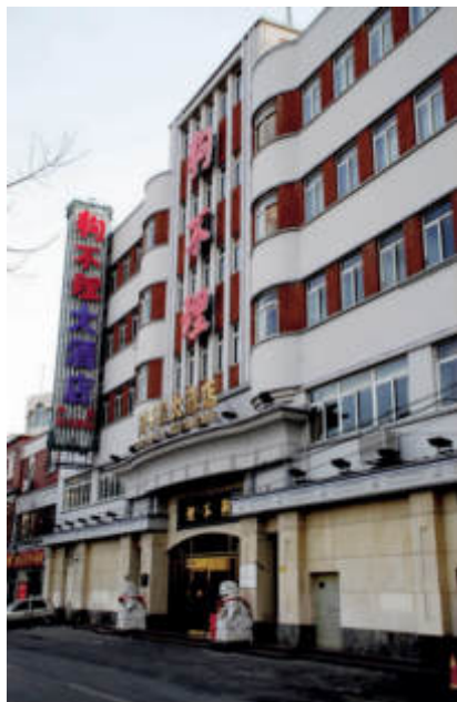
中共平津唐点线工作委员会旧址现状(和平区和平路322号)

在中共晋察冀中央分局和冀热察区党委领导下，“点线工委”恢复和重建了党的组织，发展了