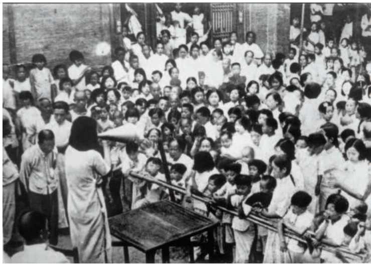
▲爱国学生开展抗日救亡宣传。