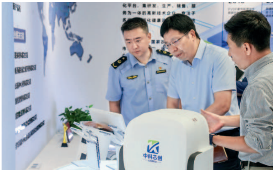
市药监局赴天津中科芯创公司调研

在一场政企恳谈会上，市药监局了解到兰力科(天津)科技集团天开应用研发有限公司迫切希望能够协调解决他们在医疗器械产品审评、注册质量管理体系现场核查中遇到的问题。恳谈会结束后，市药监局医疗器械注册部门发挥政策导航作用，积极会同市器械审查中心，主动上门服务企业，并与天开高教科创园管委会等部门取得联系，采取提前介