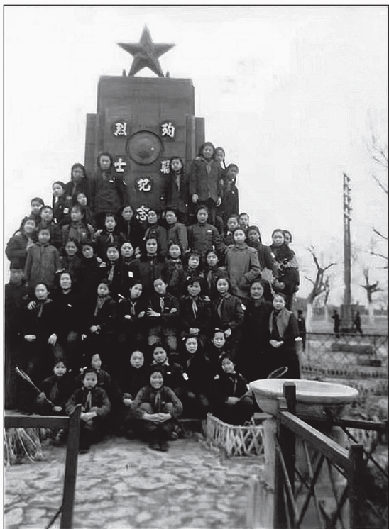
宁园烈士碑初建时期的场景

宁园烈士碑耸立在北宁公园叠翠山的最高处,碑高13.6米,长、宽均为2.7米,汉白玉材质,碑顶部为仿古琉璃瓦屋脊造型。碑阳铭刻“革命烈士永垂不朽”八个金字。碑阴的文字令人心潮澎湃:“成千成万的先烈,为着人民的利益,在我们的前头英勇地牺牲了。让我们高举他们的旗帜,踏着他们的血迹前进吧!”这段文字出自毛泽东于1945年4月24日在中共七大上所作的政治报告《论联合政府》。此