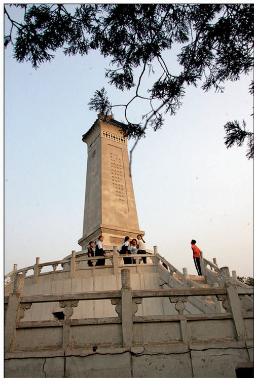
1977年重建后的宁园烈士碑