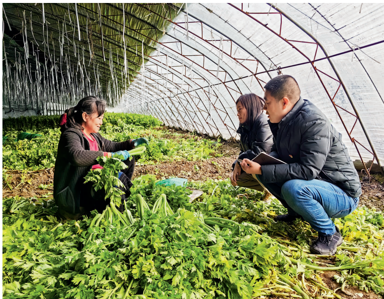
静海区纪检监察干部深入乡镇果树种植基地向群众了解相关情况

在开展“激励担当作为年”活动上聚力用劲。具体化落实“三个区分开来”,突出严管厚爱相结合、激励约束并重,打造领导为干部担当、机关为基层担当、政府为企业担当的“担当生态链”,在招商引资、项目建设、生态环保等重点领域,稳慎精准问责,持续加大容错纠错、澄清正名、回访教育工作力度,严肃查处诬告陷害行为,用好考核指挥棒,营造干部敢为、企业敢干、群众信任的良好发展环境。✎