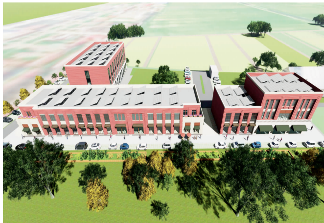
田园商业综合体一期效果图